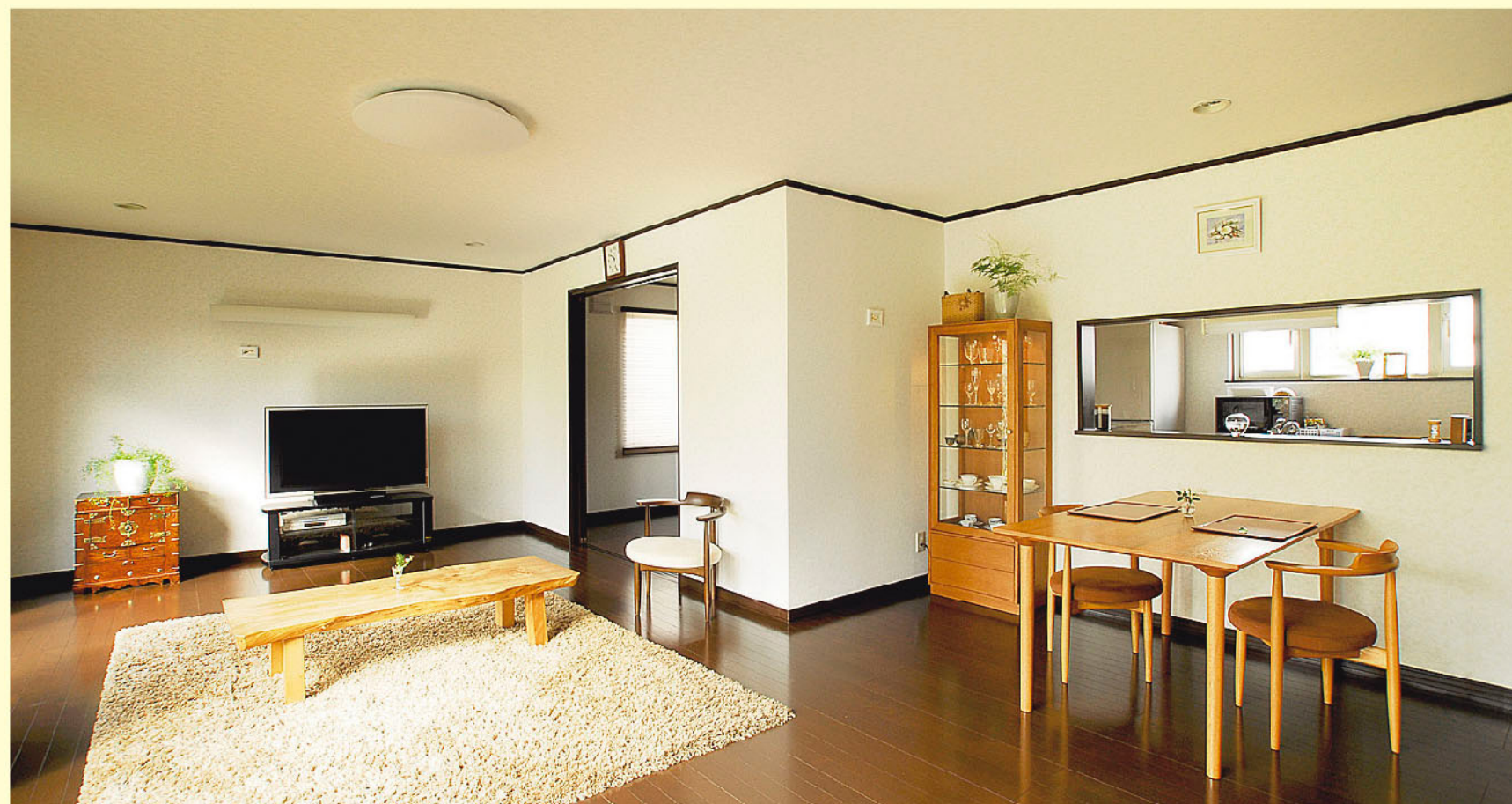
リビングを約2倍の広さに拡張し、キッチンを対面式に変更。リビングからもキッチンからも庭の景色を満喫できます。